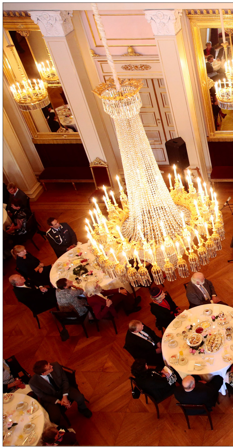
KONGETE: Ole Paus syng for dei kongelege og dei 65 inviterte eldsjelene frå heile landet.

– Men det har dykk som er her i dag valt å gjera. Difor set mange menneske stor pris på dykk. Difor